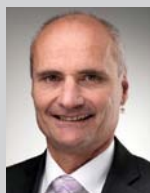
Regierungsrat Ueli Amstad Vorsteher der Landwirtschafts- und Umweltdirektion des Kantons Nidwalden

Welches sind die Gründe für die Verdichtung von landwirt- schaftlichen Böden? Und was misst ein Tensiometer? Lesen Sie dazu mehr in diesem Newsletter.