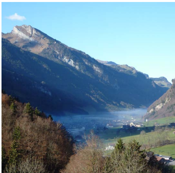
Frühmorgens im Muotathal, November 2011:

In Bergregionen sind Holzfeuerungen weit verbreitet, von der Zentralheizung bis zum Kochherd. Schlecht gewartete oder veraltete Holzfeuerungen stossen übermässig viel Feinstaub aus. Auch die Verwendung von ungeeigneten Brennstoffen oder der falsche Betrieb der Holzfeuerungen erhöhen den Feinstaubausstoss erheblich. In solchen Fällen enthält der Feinstaub besonders viele giftige polyzyklische aromatische Kohlenwasserstoffe (PAK). Die Messungen im Schächental und im Muotathal haben ergeben, dass der Anteil dieser zum Teil krebserregenden Substanzen deutlich grösser ist als in der Stadt (siehe Grafik).