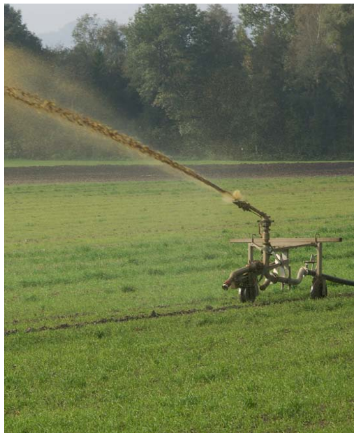
Rund um das Wauwilermoos (im oberen Teil des Bildes ist der das Gebiet begrenzende Baumgürtel erkennbar) wird vorwiegend intensive Landwirtschaft betrieben. Der Stickstoff aus der Gülle wird über die Luft transportiert und zerstört mit den Jahren den Lebensraum von Arten, die wenig Nährstoffe brauchen. Die Aufnahme stammt aus dem Jahr 2005.

Peter Bucher, Umwelt und Energie Kanton Luzern peter.bucher1@lu.ch